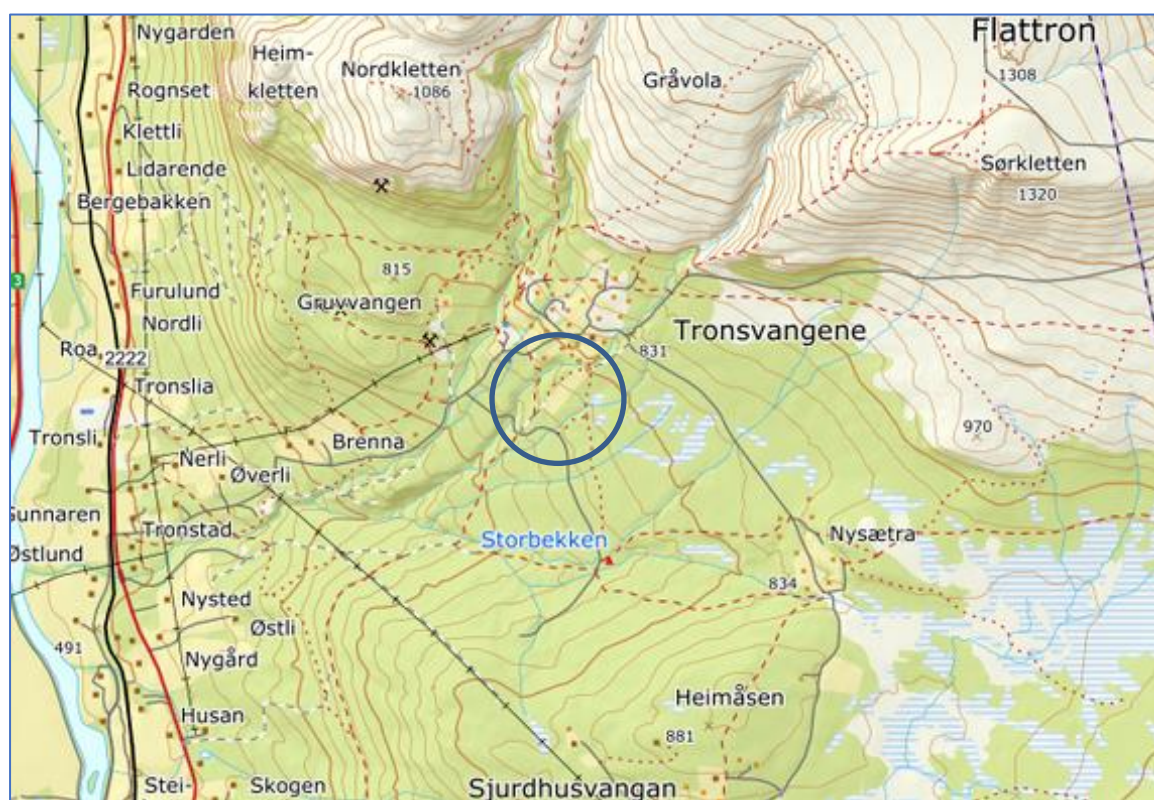
Oversiktskart som viser planområdets beliggenhet ved Tronsvangen.

Formålet med detaljreguleringen er å tilrettelegge for et nytt hytteområde ved Tronsvangen. Den nye fritidsbebyggelsen skal tilpasses landskapet og samtidig tilrettelegge for ny bebyggelse. I et overordnet perspektiv må også planområdet vurderes som en del av et større turist- og friluftsområde på Tronsvangen og videre opp mot Tronfjell. Tronsvanglia gir god tilgjengelighet og nærhet både mot Østkjølen og Trontoppen.